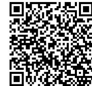
2019年工业互联网试点示范推荐项目情况表